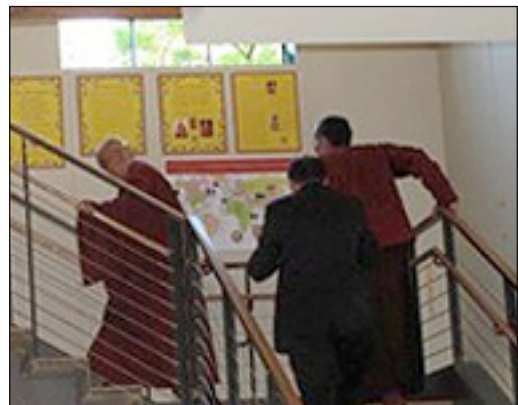
El Paquete de presentación da la bienvenida a los visitantes mientras ascienden las escaleras hacia el lugar de trabajo en la sede de la oficina internacional.

El Paquete de presentación es para que lo usen todos los centros, los grupos de estudio, y los diversos proyectos y servicios.